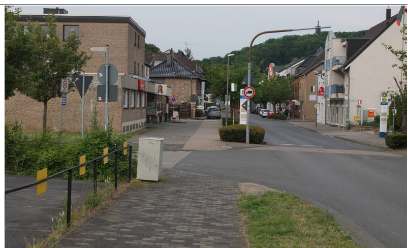
Die Nebenanlage die sich im Bild oben im gelben Oval befindet.

Diese Art Unfall ist klassisch bei Zweirichtungswegen. Autofahrer kommt von links, und will rechts abbiegen. Folglich schaut der Fahrer/die Fahrerin nur nach links , wenn man von rechts keine Radfahrer erwartet (obwohl es auch Fußgänger geben kann – es gilt hier Vorfahrt beachten). Da der weitere Verlauf eine optische Differenzierung aufweist (Gehwegbereich und Radwegbereich) liegt es nahe, dass viele Radfahrende links fahren. Entweder muss das mit Hilfe von Maßnahmen unterbunden werden, oder aber die Route muss sicherer gemacht werden.