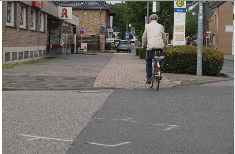
Dieser Radfahrer fuhr zufällig beim Fotografieren vorbei

Es ist auch erkennbar, dass die Autofahrerin tatsächlich rechts abbiegen wollte.